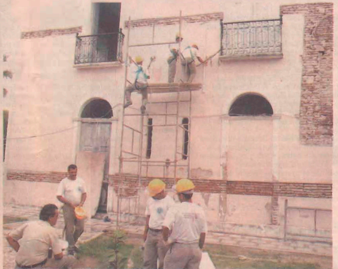
TAMBÉM FORAM descobertas janelas antigas, fechadas com as reformas efetivadas no prédio ao longo desses anos