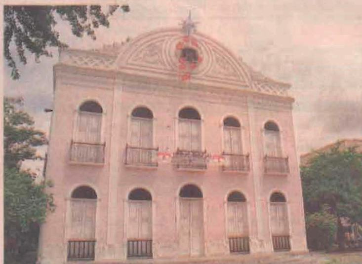
O TEATRO de Sobral foi construído 25 anos antes do teatro de Fortaleza

"Por tudo isto, a administração municipal está fazendo a sua restauração, começando com a pesquisa arqueológica, através de escavações e prospecções em busca das estruturas originais".